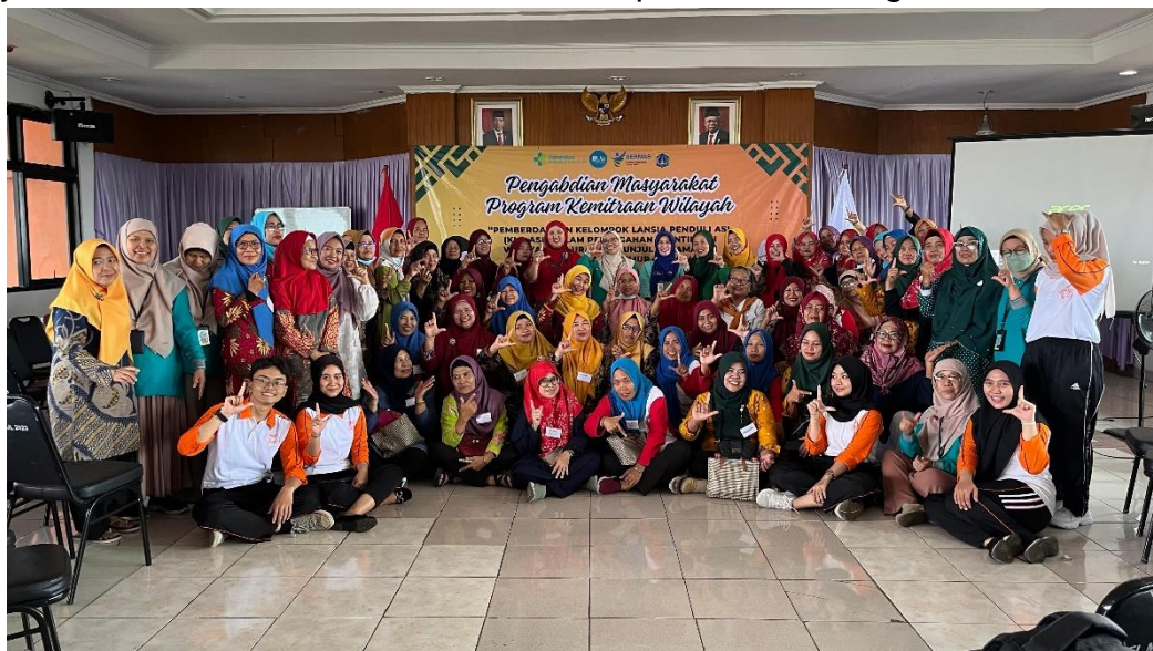
Gambar 1: peserta assessment kader Kesehatan di kelurahan munjul

Kegiatan ini menghasilkan dokumen HAKI berupa video edukasi dan buku dengan ISBN yang berjudul Pemberdayaan Kelompok Lansia Peduli ASI (KLP-ASI) dalam Pencegahan Stunting , sebagai referensi dan alat edukasi bagi masyarakat. Dibawa ini adalah dokumentasi pelaksanaan kegiatan