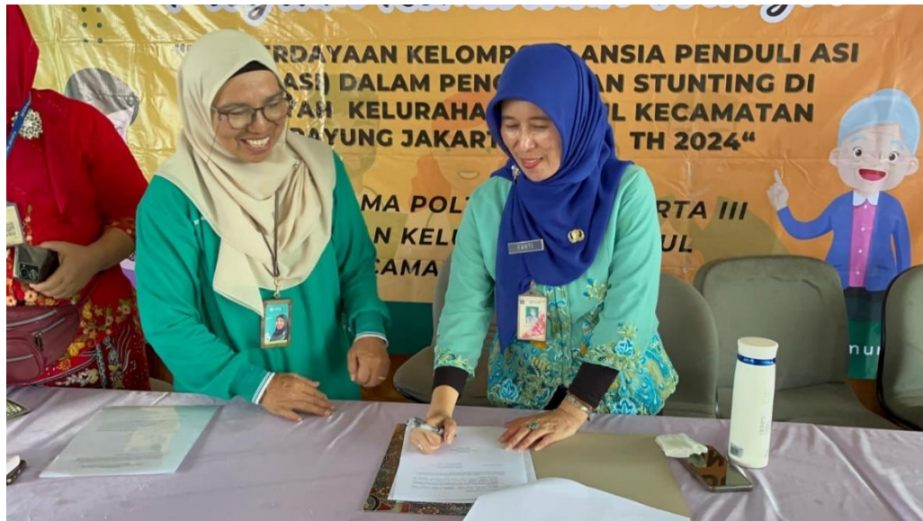
Gambar 2: penanda tangan kesepakatan pelaksanaan program KLP-Asi dengan Kelurahan Munjul

Kegiatan ini menghasilkan dokumen HAKI berupa video edukasi dan buku dengan ISBN yang berjudul Pemberdayaan Kelompok Lansia Peduli ASI (KLP-ASI) dalam Pencegahan Stunting , sebagai referensi dan alat edukasi bagi masyarakat.