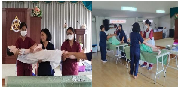
Gambar 2. Demonstrasi pemulasaran jenazah

Pemberian edukasi yang diberikan oleh tim PKM memberikan dampak yang nyata pada peningkatan pengetahuan dan keterampilan sesudah dilakukan pendampingan kedukaan serta perawatan jenazah. Berdasarkan data yang telah dilampirkan dapat disimpulkan bahwa terdapat perbedaan yang nyata atau signifikan antara hasil tingkat pengetahuan masyarakat tentang Upaya Pemberdayaan dan Peningkatan Keterampilan Pendampingan Kedukaan Serta Perawatan Jenazah pada data pretest dan post test. Upaya pelatihan pemulasaraan jenazah ini dapat memberikan impact positif untuk para peserta yang mengikutinya. Hal ini sesuai dengan capaian kegiatan Pengabdian kepada Masyarakat yang dilakukan oleh (Rizqiani & Rini, 2023) bahwa terdapat peningkatan pengetahuan dan keterampilan dalam melakukan pemulasaraan jenazah bagi mahasiswa dan masyarakat. Sebanyak 91,25% responden mengaku bahwa dampak adanya pelatihan ini sangat baik karena mereka menjadi lebih terampil karena dilakukan demonstrasi dan redemonstrasi serta pendampingan bagi peserta dalam proses pemulasaraan jenazah. Peserta juga diajarkan bagaimana mendampingi seseorang atau anggota keluarga yang sedang berduka.