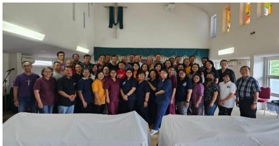
Gambar 1. Foto bersama peserta

Kegiatan pengabdian kepada masyarakat yang dilakukan oleh civitas akademik STIKes PGI Cikini bermanfaat bagi masyarakat khususnya dalam upaya pemberdayaan dan peningkatan keterampilan pendampingan kedukaan serta perawatan jenazah bagi jemaat gereja Kristen Jawa Bambu Kuning Bekasi Utara. Kegiatan ini mendapatkan dukungan penuh dari Pemimpin dan Jemaat Gereja Kristen Jawa Bambu Kuning Bekasi Utara begitu juga pimpinan STIKes PGI Cikini. Kegiatan PKM yang dilakukan dalam bentuk penyampaian materi dan melakukan keterampilan pendampingan kedukaan serta perawatan jenazah.