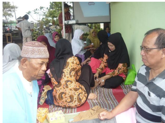
Gambar 1. evaluasi