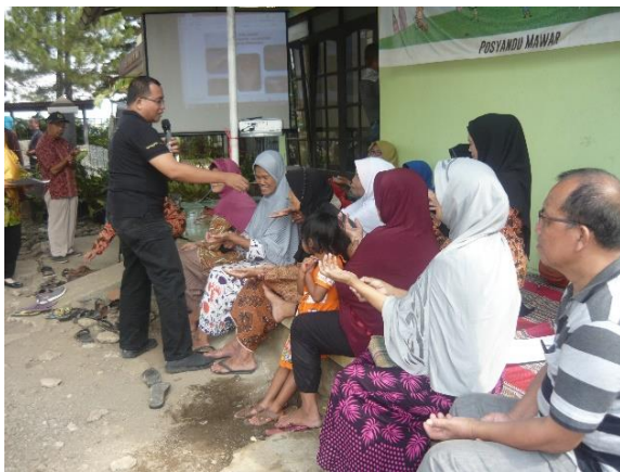
Gambar 4. diskusi dan tanya jawab