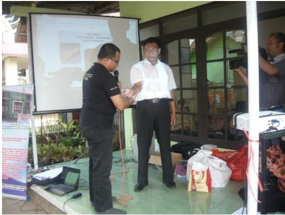
Gambar 2. penyampaian materi