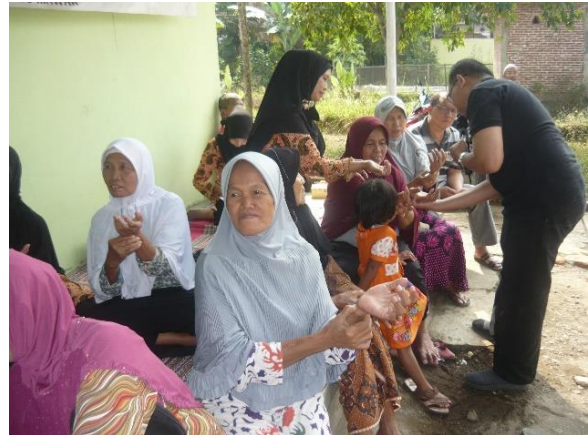
Gambar 3. praktek pelaksanaan akupresur